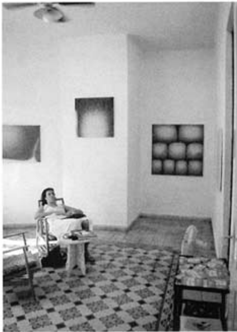
Ram Samocha, "Scalps - Farewell Exhibition", 2000, general view